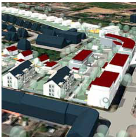
GRAFIK: UWE FOHMANN